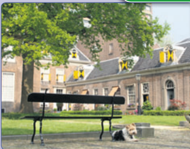
• HOFJE VAN STAATS