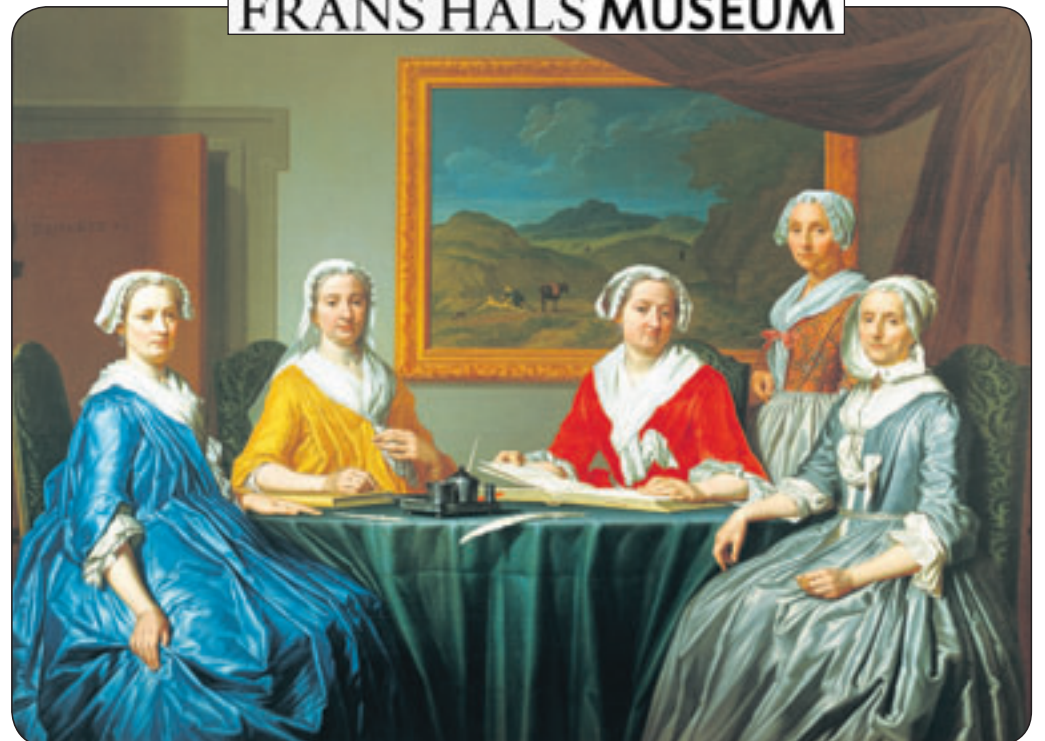
'De regentessen van het Sint Elisabeths Gasthuys' van Frans Decker

V oor het opvallende kleurgebruik van Frans Decker is een reden. De dames dragen zomerkleding, die in de 18de eeuw kleurig was. Men volgde de Franse mode.