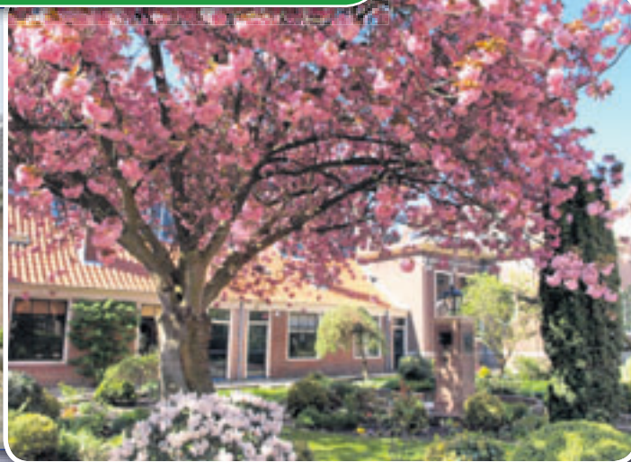
• LUTHERS HOFJE