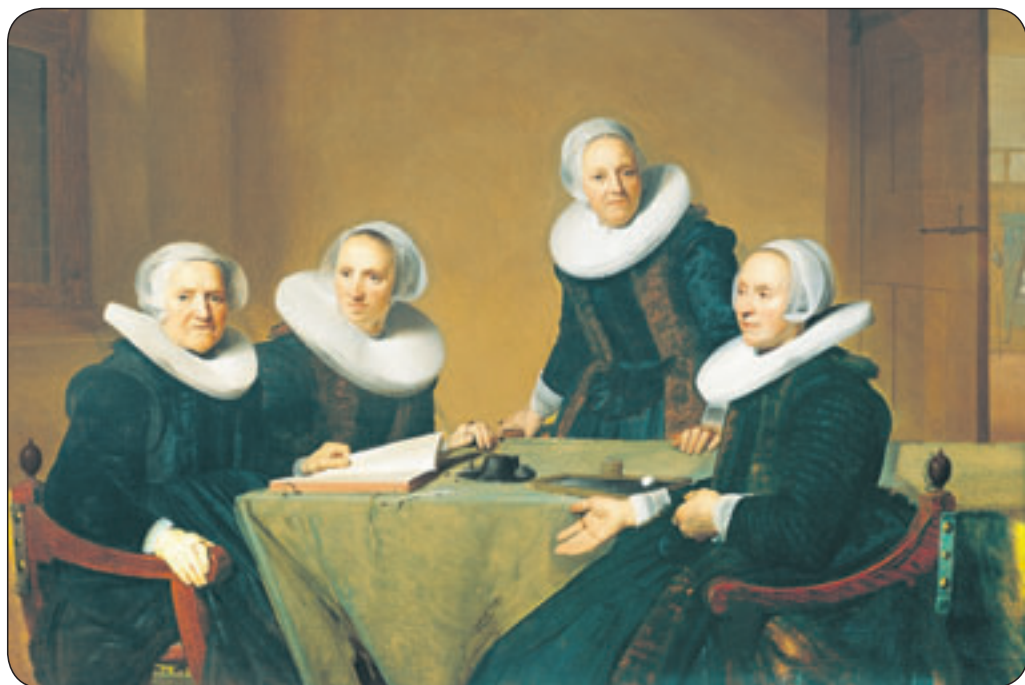
'De regentessen van het Sint Elisabeths Gasthuys' van Johannes Verspronck

'De regentessen van het Sint Elisabeths Gasthuys' van Frans Decker is vrijdag 15 maart officieel door het Elisabeth Thüringfonds geschonken aan het Frans Hals Museum. Qua compositie is dit schilderij waarschijnlijk gebaseerd op het schilderij van Johannes Verspronck. Beide regentenstukken zijn van via bruikleen museaal bezit geworden.'